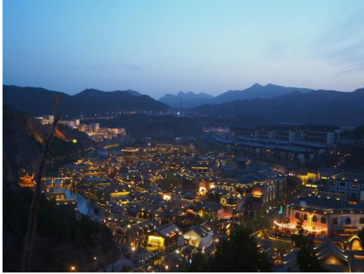
左圖:傍晚的古北水鎮。