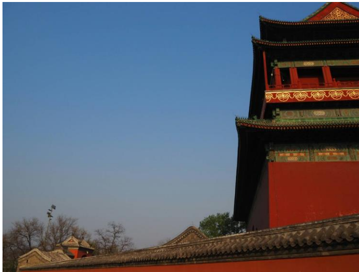
左圖:南鑼鼓巷 鐘樓鼓樓