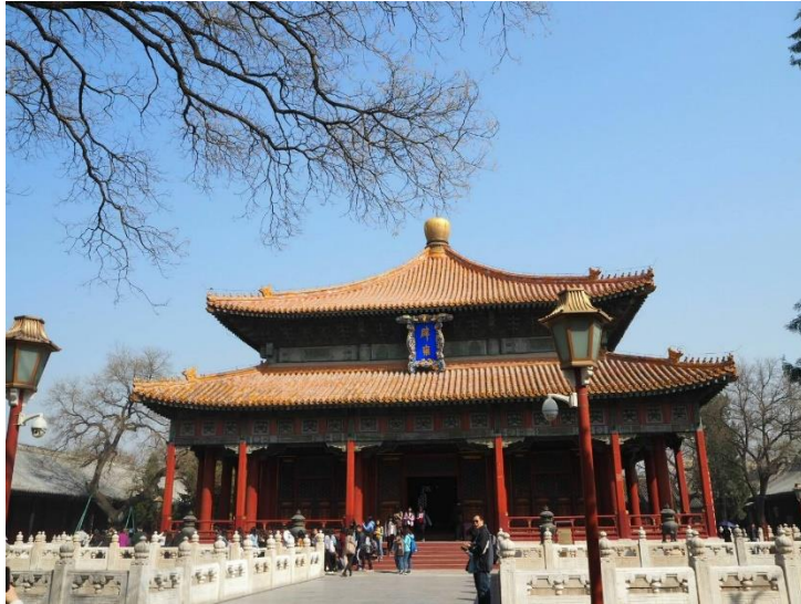
左圖:辟庸，「天子之學曰 辟庸」皇帝講學的地方。