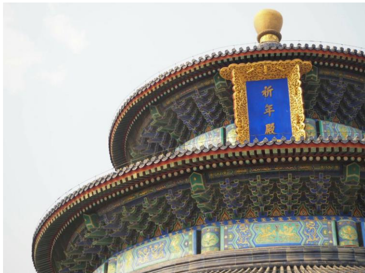
左圖:天壇祈年殿，祈雨祈 穀的地方。