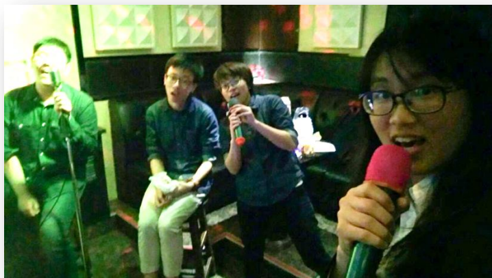
離情依依，與學伴去唱歌